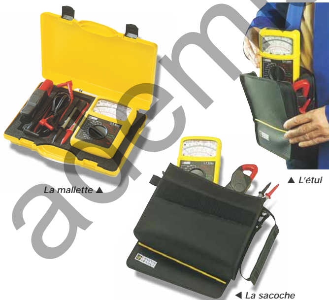
▲ La mallette