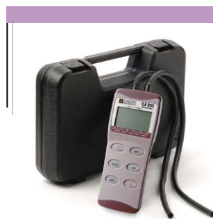
Livré en mallette avec ses accessoires